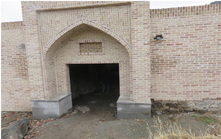
تصویر شماره ۳