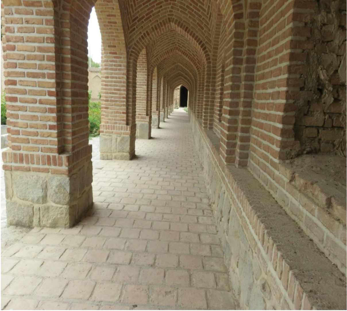
تصویر شماره ۹