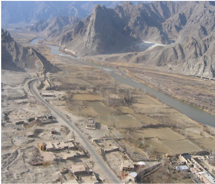
تصویر شماره ۲