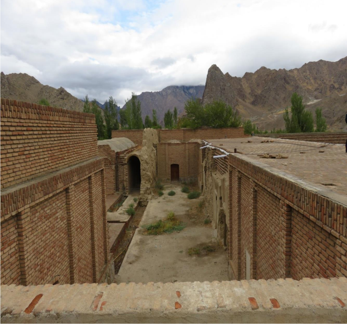
تصویر شماره ۸