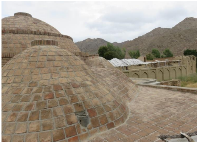
تصویر شماره ۳