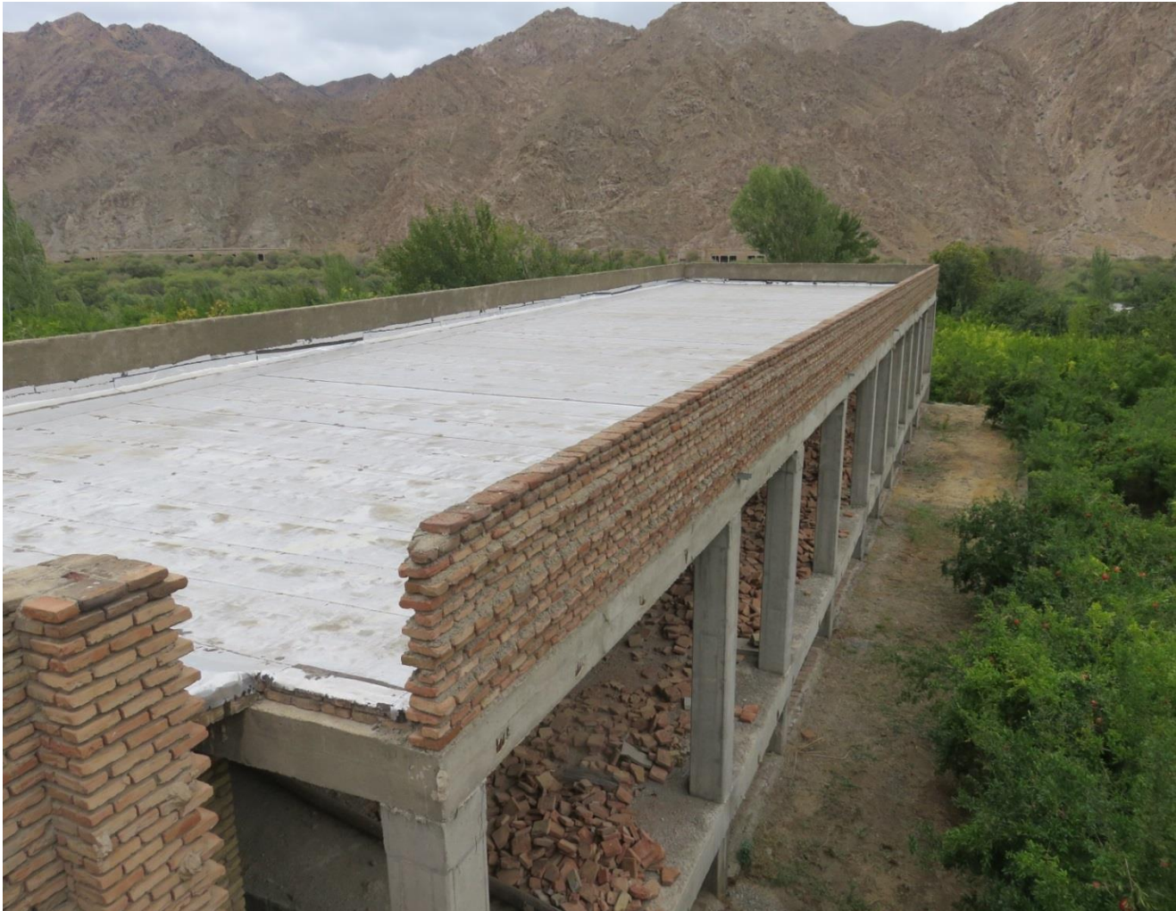
تصویر شماره ۶