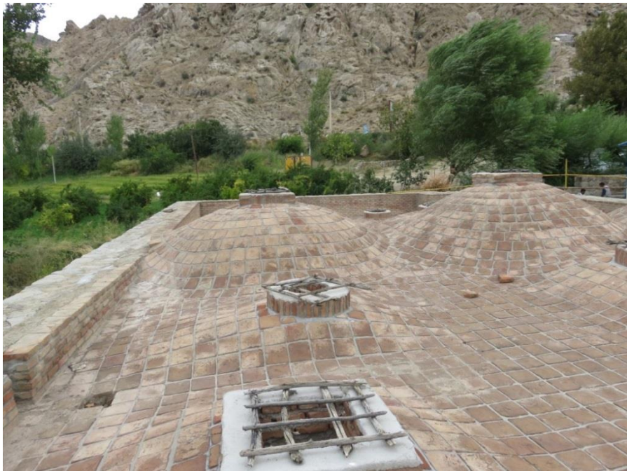
تصویر شماره ۱