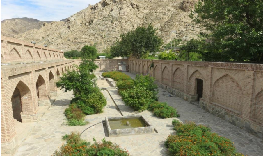
تصویر شماره ۴