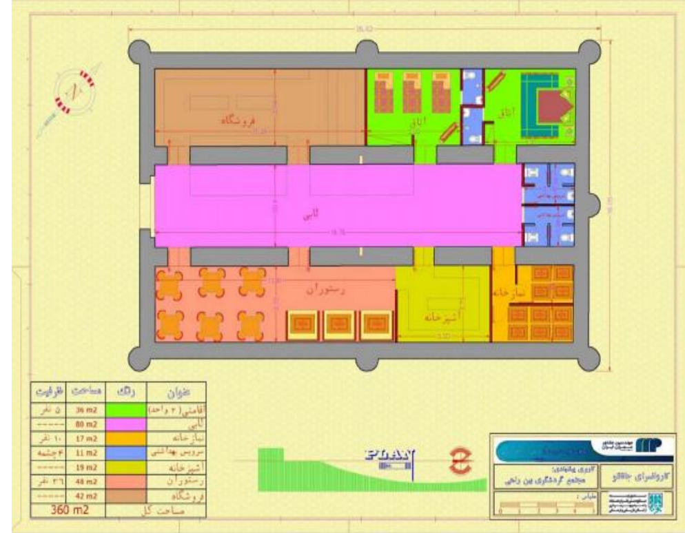
Ground Floor Plan