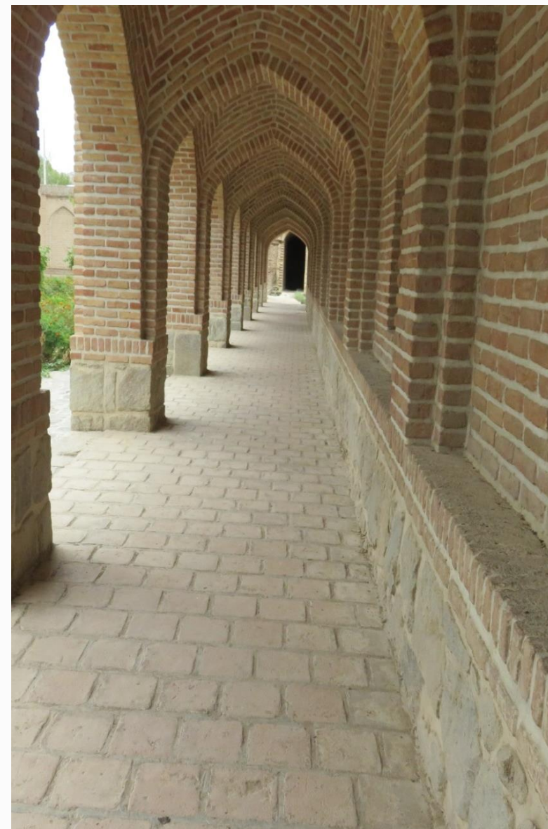
عکس های مربوط به بنا تاریخ عکس ۱۴۰۰