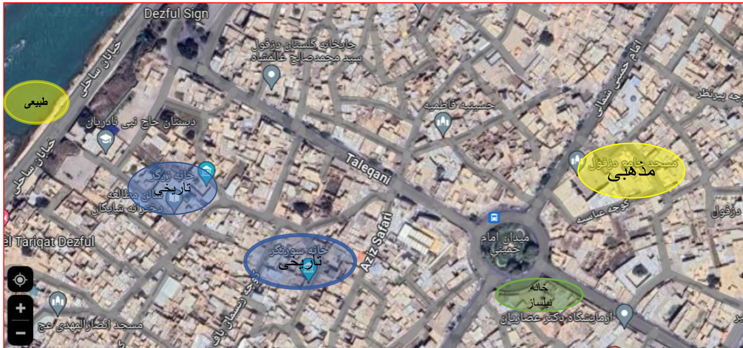
نقشه زون بندی منطقه