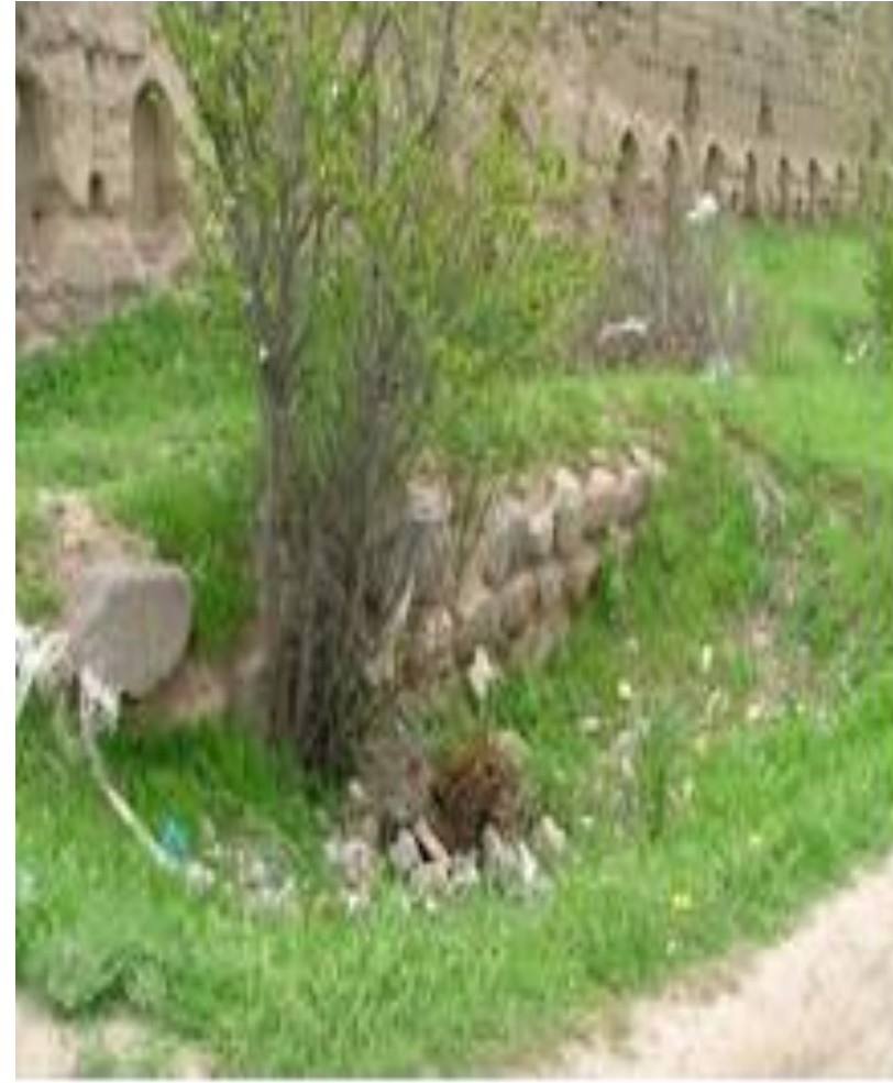
دیوار سنگی داخل قلعه