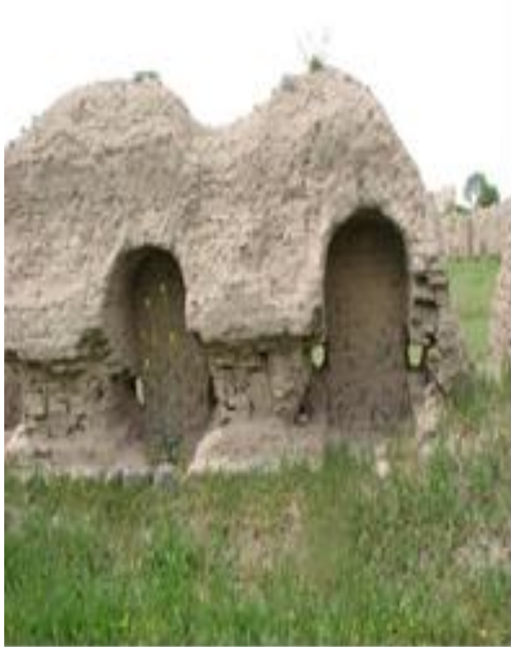
طاقچه های داخل اصطبل (آخور)

وزارت میراث فرهنگی گردشگری صنایع و فرهنگ