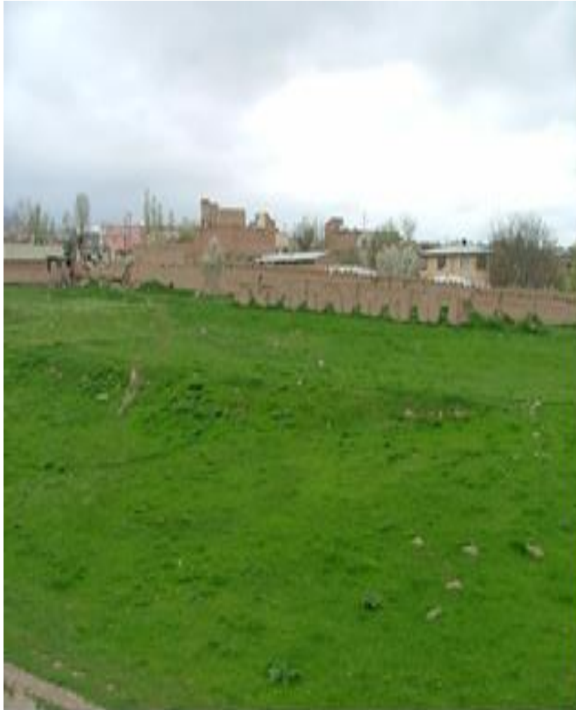
نمای غربی و داخل قلعه