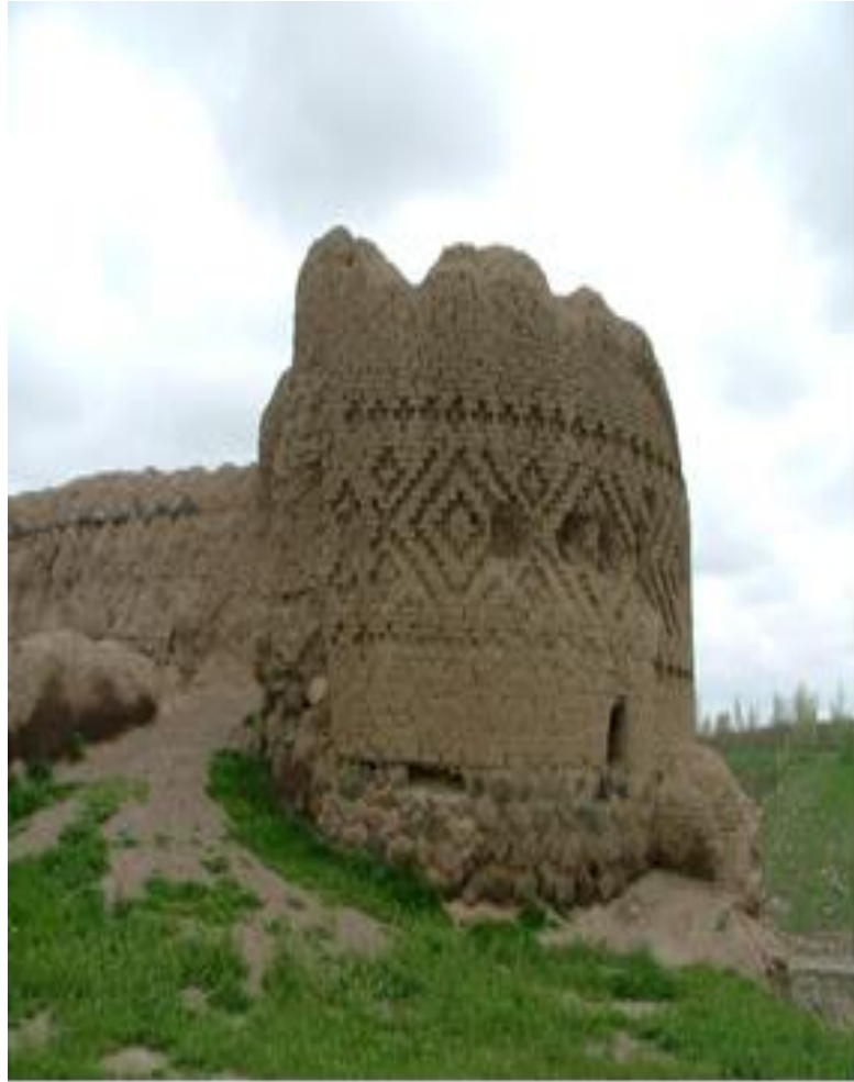
برجک ضلع شرقی

وزارت میراث فرهنگی گردشگری صنایع و فرهنگی