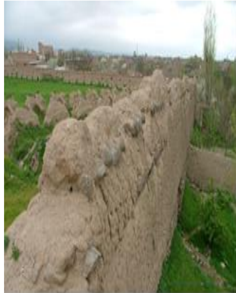
معماری کنگره ای روی دیوار قلعه