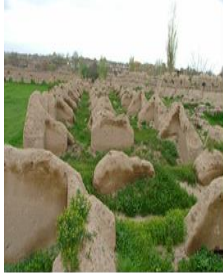
قسمت اداری در ضلع شمالی