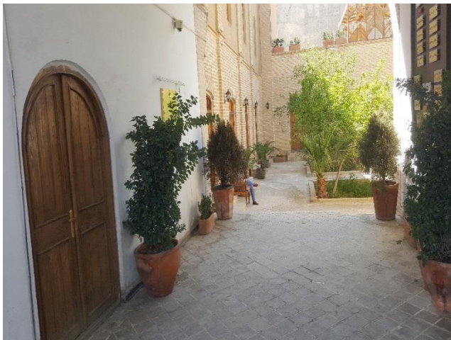
نمای داخلی محوطه بنا- سال ۹۹