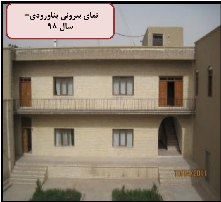
نمای بیرونی بنا ورودی - سال ۹۸