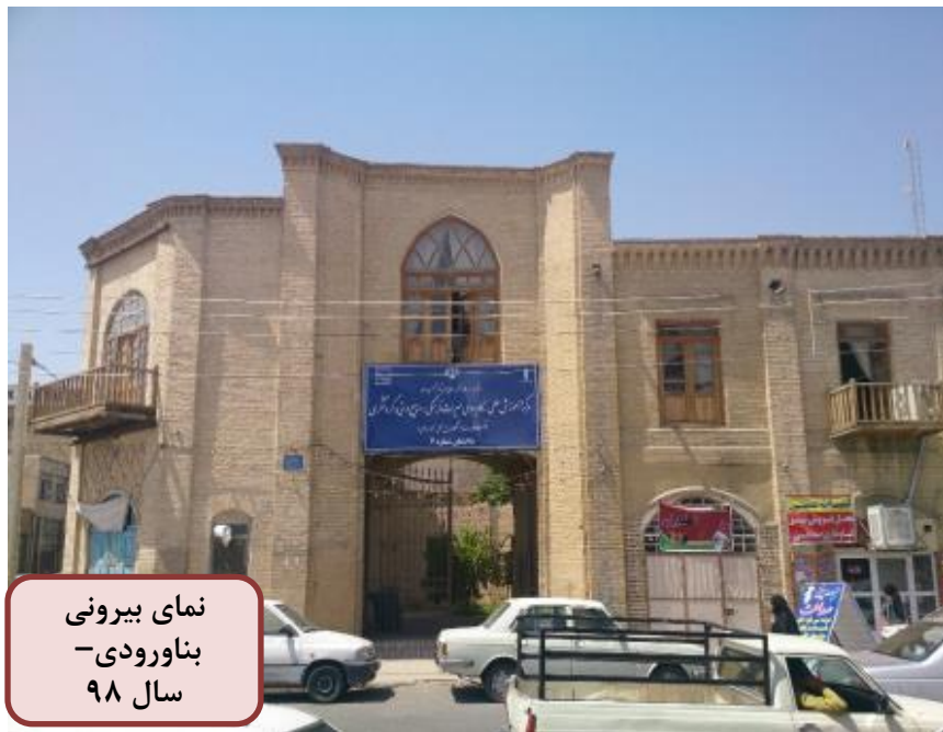
نمای بیرونی بناورودی- سال ۹۸