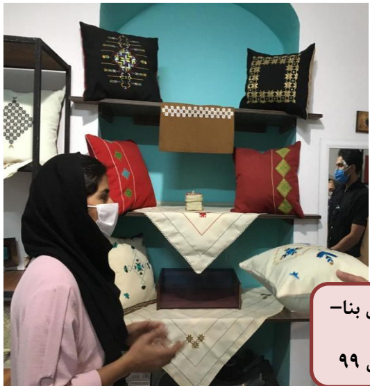
داخل بنا- سال ۹۹