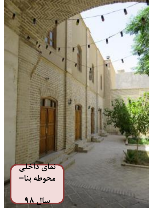
نمای داخلی محوطه بنا- سال ۹۸