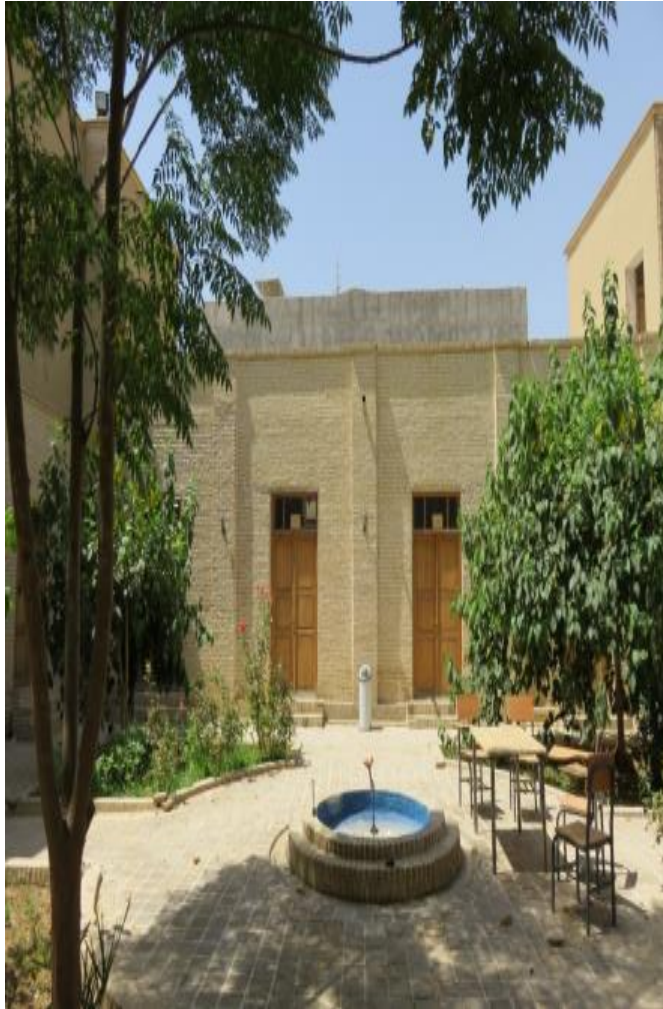
نمای داخلی بنا حیاط - سال ۹۸