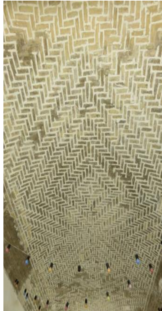
پوشش آجرکاری سقف بنا سال ۹۸