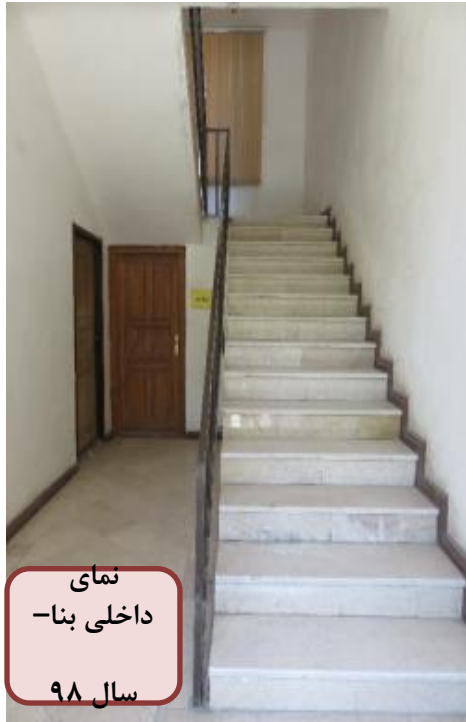
نمای داخلی بنا- سال ۹۸