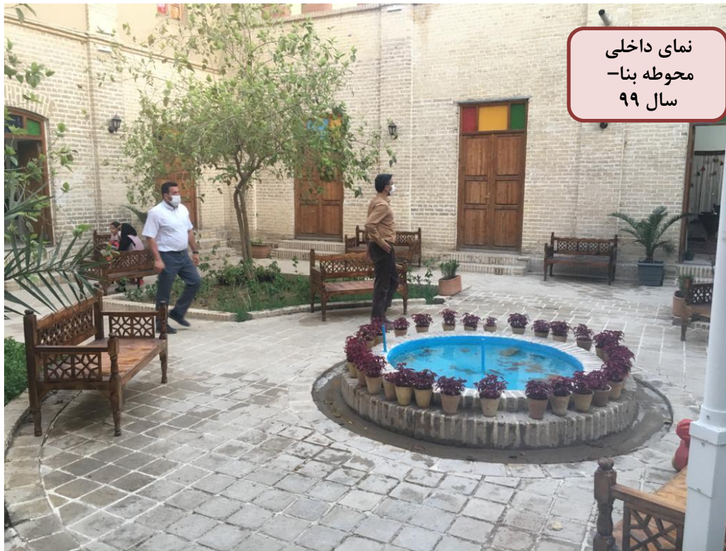
نمای داخلی محوطه بنا- سال ۹۹