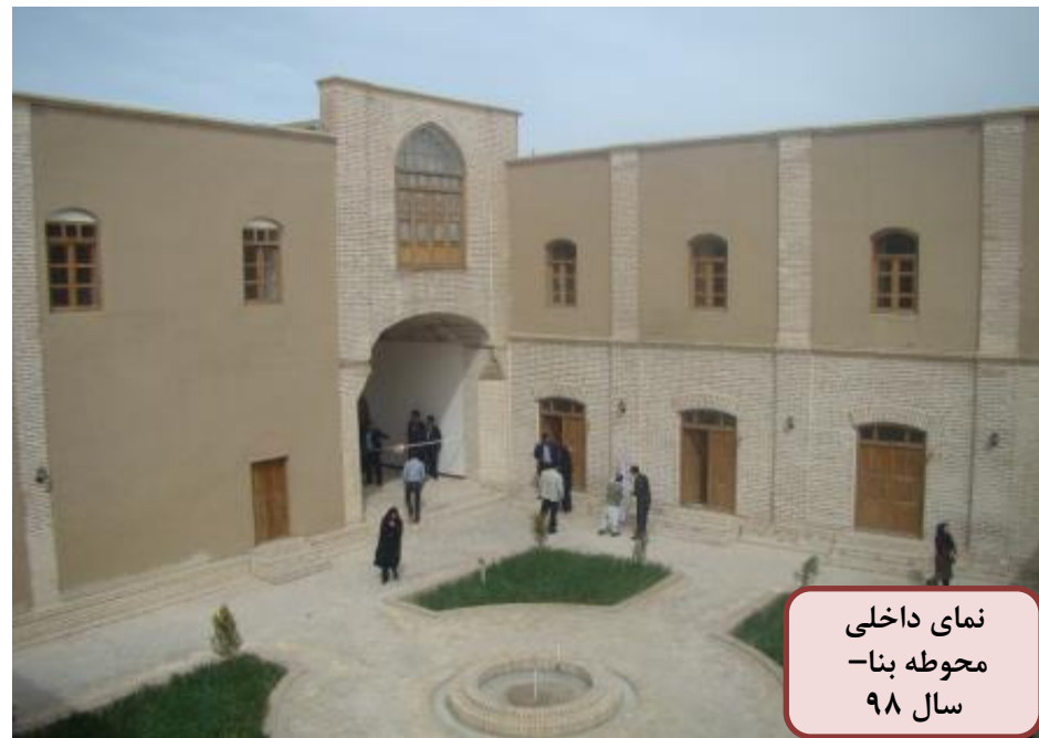
نمای داخلی محوطه بنا- سال ۹۸