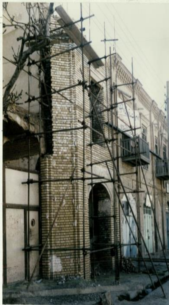
عکس قدیمی در حال مرمت نمای بنا