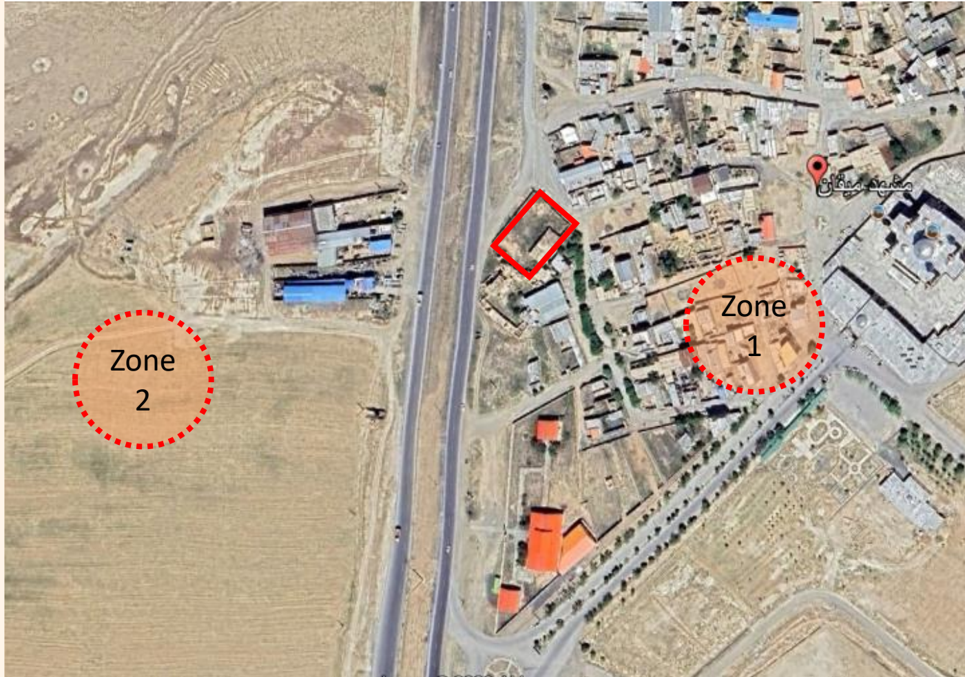
نقشه زون بندی منطقه