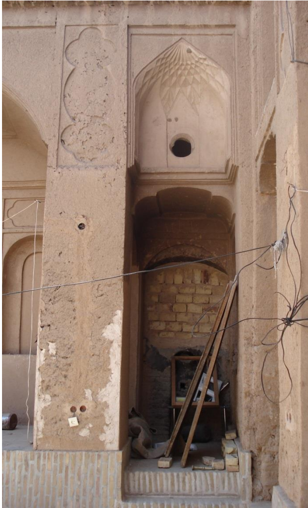
تصویر شماره ۴