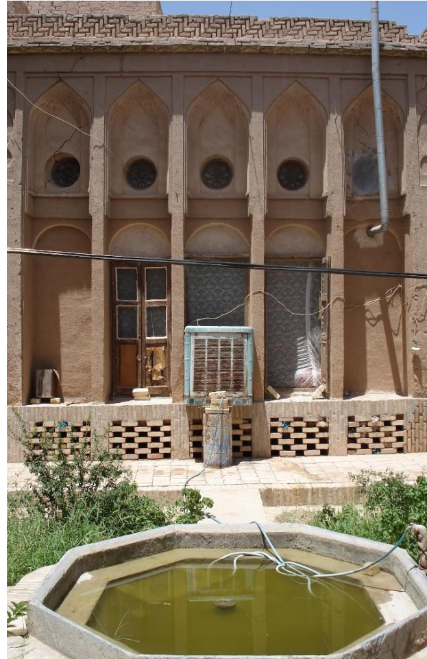
تصویر شماره ۳