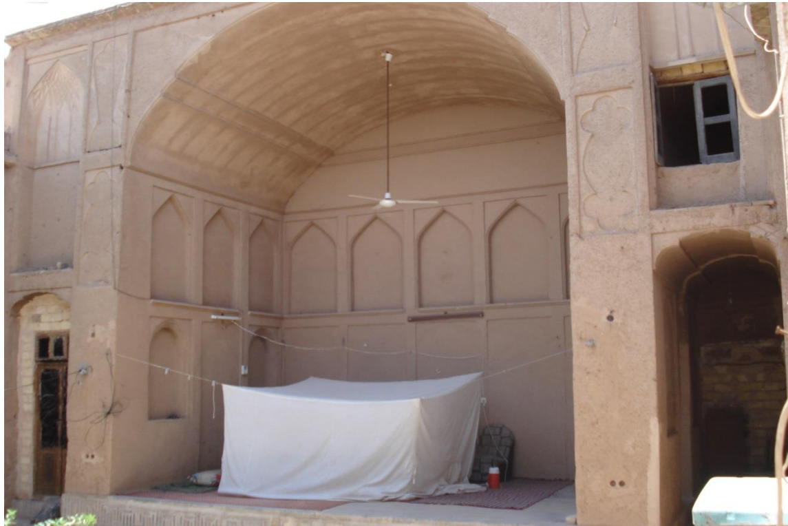
تصویر شماره ۱