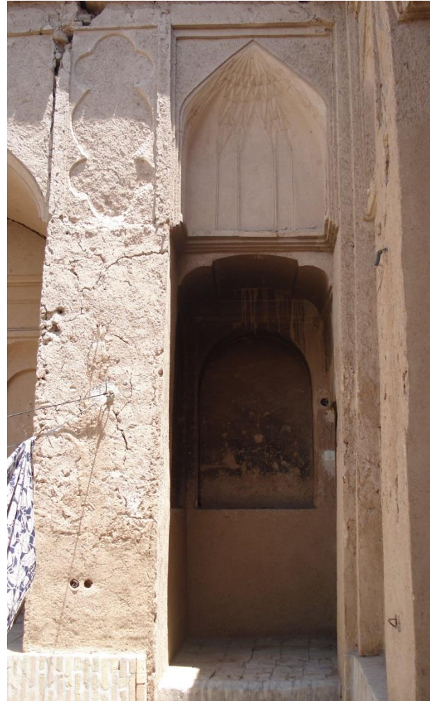
تصویر شماره ۵