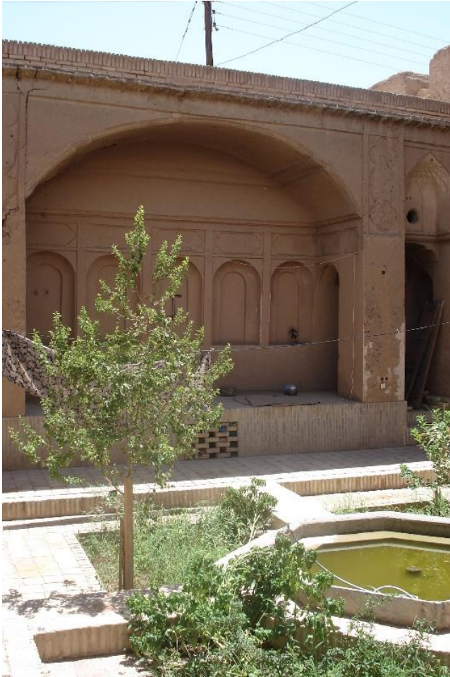
تصویر شماره ۲