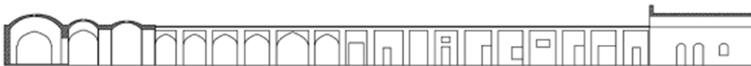
نما - مقطع A-A